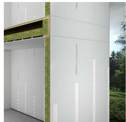
1HG32-500 fermacell hoonete vaheline sein (REI90väljas/REI30isees)