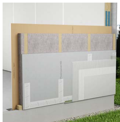
1HA12-520 fermacell puitkarkass-sein (REI30) ■ Pötkliidete teipimiseks – fermacell™ Tape AWS ■ Kinnitusvahendite katmine – fermacell™ Tape AWS