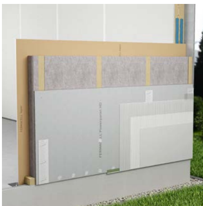
1HA12-520 fermacell puitkarkass-sein (REI30) ■ Pötkliidete teipimiseks – fermacell™ Tape AWS ■ Kinnitusvahendite katmine – Powerpanel HD armeerimisliim

Järgida tuleb fermacell® välisseinasüsteemi paigaldamisjuhiseid (vt ka projekteerimine ja paigaldamine: fermacell® und JamesHardie® puitehitistes).